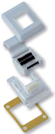
Abdeckrahmen mit Montageschlitz

NEU! Die Montage erfolgt ohne Ausbau des Rollladengurts. Auch als „Mini-Gurtführung“ erhältlich.