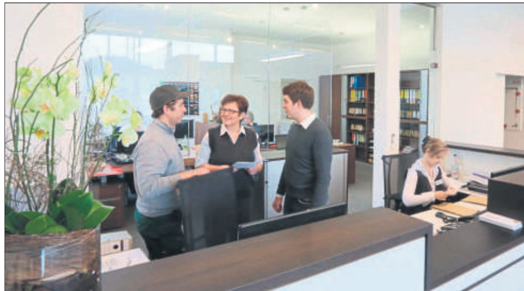
Familienbetrieb Schwarzer: immer auf der Suche nach der besten Lösung für die Kunden.

Vorteil für die Kunden: Im neuen Handwerks- und Kompetenzzentrum der Schwarzer GmbH werden in modernem, großzügigem und angenehmen Ambiente Renovierungslösungen und Wohnraumkonzepte rund um Fenster, Rollläden, Wohndachfenster, Haustüren, Innentüren und vieles mehr präsentiert.