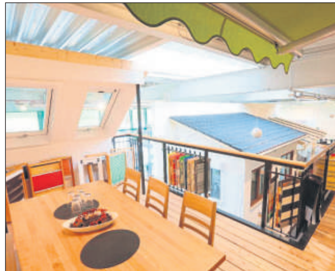
So funktioniert, Wohnen, Bauen, Renovieren.

Als Highlight der Ausstellung gilt der neue Produktbereich Wintergarten und Sommergarten. Hier finden Sie Inspirationen für Ihren neuen Lieblingsplatz - weil es zu Hause am Schönsten ist.